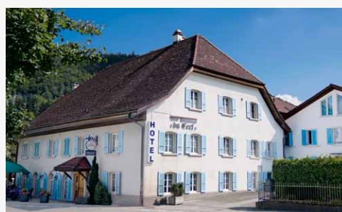
l'Hôtel-restaurant du Cerf